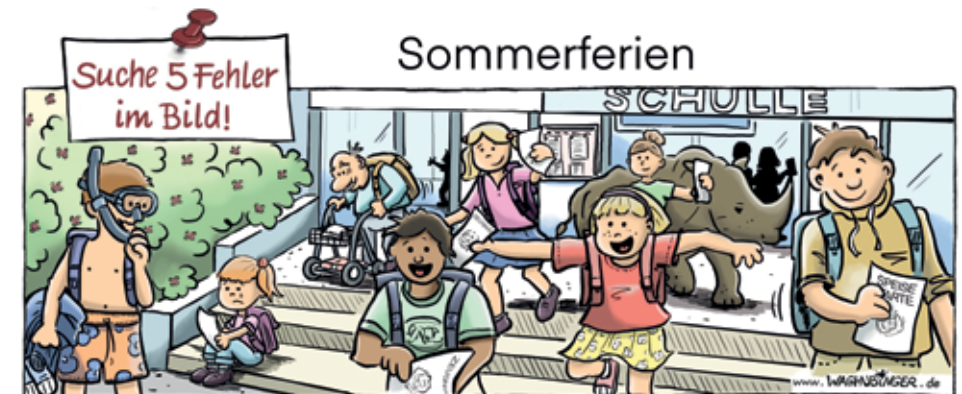
Taucher alter Mann, Nashorn, Schulle, Schulle, Speisekarte

Sonntags von 10.00-11.00 Uhr EV. GEMEINSCHAFT, Die Kinder können ab 9.50 Uhr gebracht werden und nach HOHER WEG 3, NDD Absprache bis zum Ende des 10-Uhr-Gottesdienstes betreut werden. Stephan Schmidt (7767) Iris Wagner (2436)