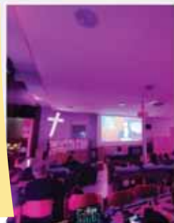
Kleingruppenarbeit beim PRESBYTERTAG (Wycliff)

Hier ein paar Eindrücke einer arbeitsreichen Zeit. Es war einiges los in unserer Gemeinde! Herzlichen Dank für die Mitarbeit an den verschiedenen Aktionstagen!