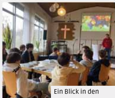
Ein Blick in den KONFI-UNTERRICHT