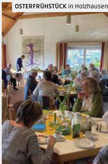
Ein liebevoll vorbereitetes OSTERFRÜHSTÜCK in Holzhausen

TRUESTORY für alle Teens unseres Solidarraums