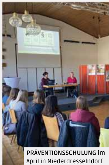
PRÄVENTIONSSCHULUNG im April in Niederdreselndorf