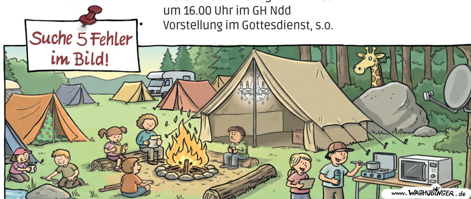
Tannenbaum, Kronleuchter, Giraffe, Mikrowelle, Satellitenschüssel