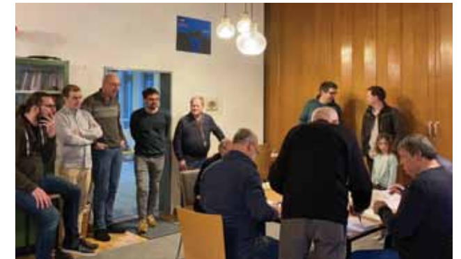
HIER: ÖFFENTLICHE AUSZÄHLUNG DER WAHLZETTEL